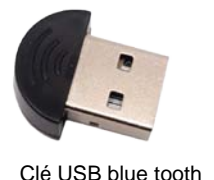
Clé USB blue tooth