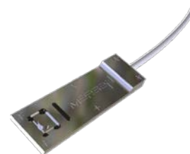
Sonde de mesure