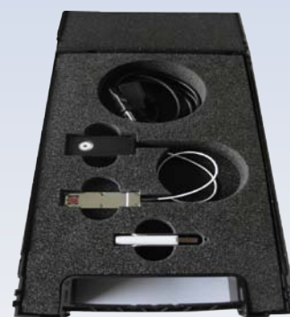
Kit complet dans sa mallette de protection

Il est donc très important de contrôler régulièrement la pression exercée par les ressorts sur les balais.