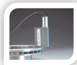
Mesure en appui sur vé frontal