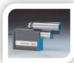
Mesure à l'envers